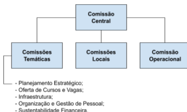
Figura 1: Estrutura das comissões do PDI 2024-2028

A base da metodologia, como já mencionado, contempla a ampla participação da comunidade do IFRS, com a atuação de comissões locais e comissões temáticas, que terão os trabalhos articulados por uma comissão central e apoiados por uma comissão operacional. A Figura 1 ilustra a organização dessas comissões, que conduzirão a atualização do PDI vigente para elaboração do novo documento.